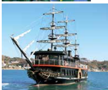
遊覧船・黒船「サスケハナ」。約20分で下田港内を1周する。