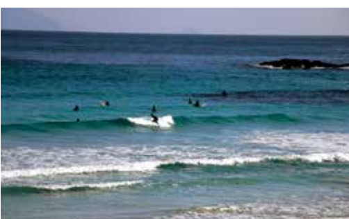
700mの美しい砂浜が続く、白浜大浜海岸。秋もサーファーが足を運ぶ。

まずは下田ロープウェイ寝姿山山麓駅から山頂駅へ向かい、寝姿山自然公園の遊歩道を散策しよう。四季折々の花が植えられており、目を楽しませてくれる。展望台から下田港を眺め、縁結びのパワースポット・愛染明王堂 あいぜんみょうおうどう などを見学したら、公園の奥から延びる林道に入り、ウォーキングを始めよう。 林道の周辺には、しばらくツワブキの群生地が続く。秋は開花シーズンなので、足元を彩る鮮やかな黄色い花を愛でながら歩くのが楽しい。 東伊豆道路（国道135号線）を進むと、左手には白浜大浜海岸や漁船が並ぶ小さな港などが見えてきて、海岸線ならではの景色を満喫できる。東伊豆道路は一度海岸線を離れるが、柿崎の交差点あたりから再び海を眺めながら歩くことができ、その先のみどりが浜海遊公園がゴール。 潮風に吹かれて下田港を巡る遊覧船・黒船「サスケハナ」を眺めながら、海遊の足湯で歩き疲れた脚を癒やそう。