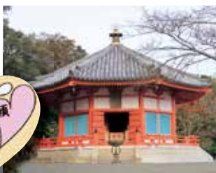
縁結びのパワースポット、愛染明王堂。ハート型の絵馬が人気。

米国・ペリー艦隊の上陸により、幕末の開国の舞台となった下田。幕末の史跡、美しい砂浜など、見どころがいっぱい。今回は下田港を一望できる寝姿山自然公園から、市街地をめざしてウォーキングしよう。