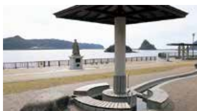
みどりが浜海遊公園にある、海遊の足湯。海を見ながらリラックス。