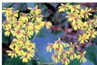
足元を彩るツワブキの花。